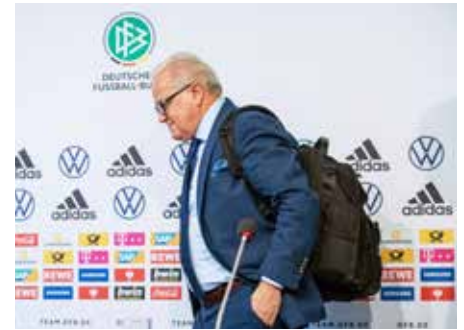
Abgang Nach 20 stressigen Monaten als DFB-Präsident packte Fritz Keller seinen Rucksack

Der größte Sportfachverband der Welt ist führungslos. Die Stellenausschreibung wäre eindrucksvoll: Knapp 24 500 Fußballvereine und mehr als sieben Millionen Mitglieder suchen einen Präsidenten. Die Aufgabe ist weltweit wichtig. Ohne dass die Suche offiziell eröffnet ist, werden schon per Zuruf in den Medien prominente Kandidaten genannt: die Politikerin Angela Merkel und Wolfgang Bosbach, die Fußballgrößen Marco Bode, Philipp Lahm, Uli Hoeneß, Karl-Heinz Rummenigge und an der Spitze einer Frauenriege die ehemalige Schiedsrichterin Bibiana Steinhaus und die Ex-Nationalspielerin Nadine Keffler. Wir wissen nicht, wer von ihnen im Ernstfall kandidieren würde, aber alle sind dem Fußball so nah, dass sie sich mit dem Schicksal des letzten Präsidenten beschäftigen würden.